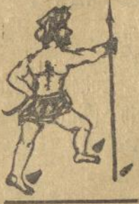
Angka radjaradja na madjoe!

Ndang na so godang sihataan molo oeng moelik Appandjoenggal toe desa desa loemobi molo oeng bongkot hoela po parhopian Al taanto ma otik sai moe ra poro halak desa boealon ni pamboe al molo tar dipabeleng halak pangalaho na ipangke sangkamata djombeng iba en parmiseanna tarlapoeba ibana Journa list isipe pontor gear angka soengkoen2 toe bongka hasida